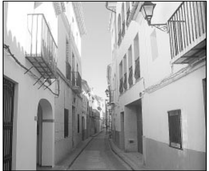
El casc antic, un dels indrets més bonics del nostre poble

Tots els veïns podran passar per l'Ajuntament a recollir aquesta enquesta.