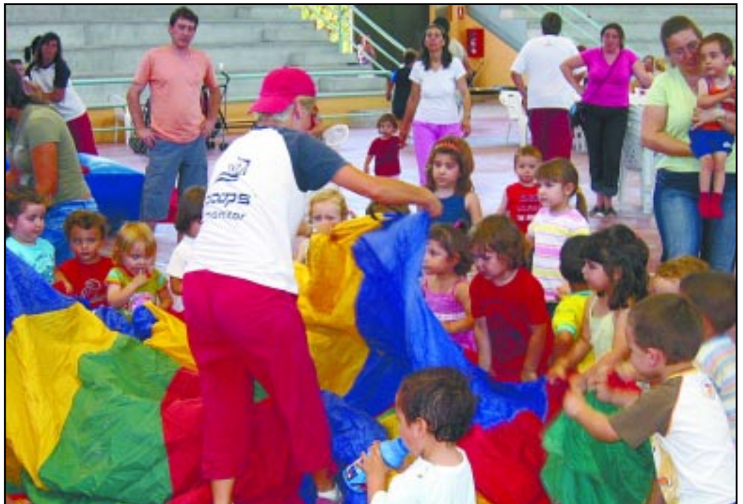
Els xiquets i xiquetes d'El Tabalet s'ho passaren d'allò més bé al Pavelló de Faura

El mateix divendres, a partir de les 20.30 hores, va tindre lloc al Pla de l'Era el berenar-festa de l'Escola