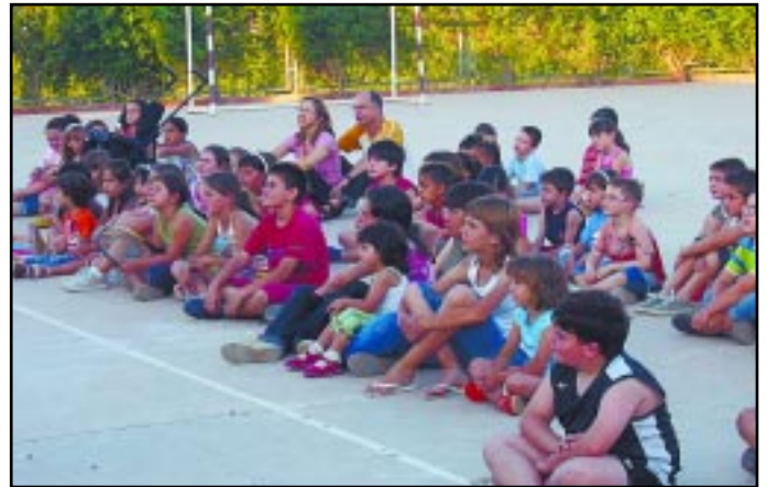
Al voltant de 150 persones acudiren al Pla de l'Era, on van presenciar l'obra El Gegant del Romaní , de Màscara Teatre